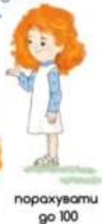
порахувати до 100