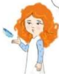
дмухати на пір'їнку