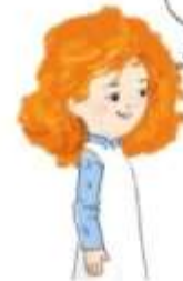
повільно проговорити алфавіт