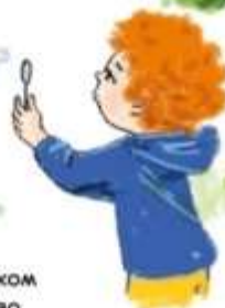
видувати мильні бульбашки