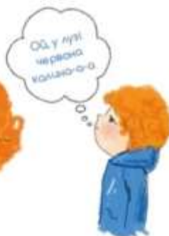
пригадати і проговорити слова пісні