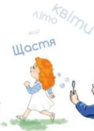
ходити, з кожним кроком називаючи якесь слово