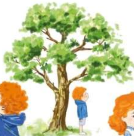
спертися на стіну, на дерево, на стіл