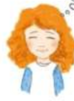
увести улюблене місце