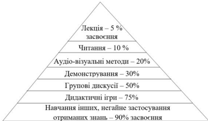
Схема 1. Піраміда навчання

Із піраміди видно, що найменших результатів можна досягти за умов пасивного навчання (лекція – 5%, читання – 10%), а найбільших – інтерактивного (групові дискусії – 50%, дидактичні ігри – 75%, навчання інших чи негайне застосування отриманих знань – 90%) [4, с. 125].